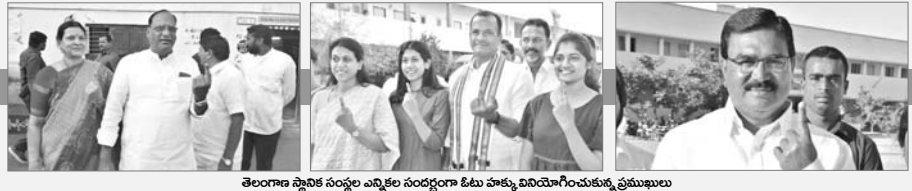
తెలంగాణ స్టాటస్ సర్వేల ఎన్నికల సందర్భంగా ఓటు హక్కు వినియోగించుకున్న ప్రముఖులు